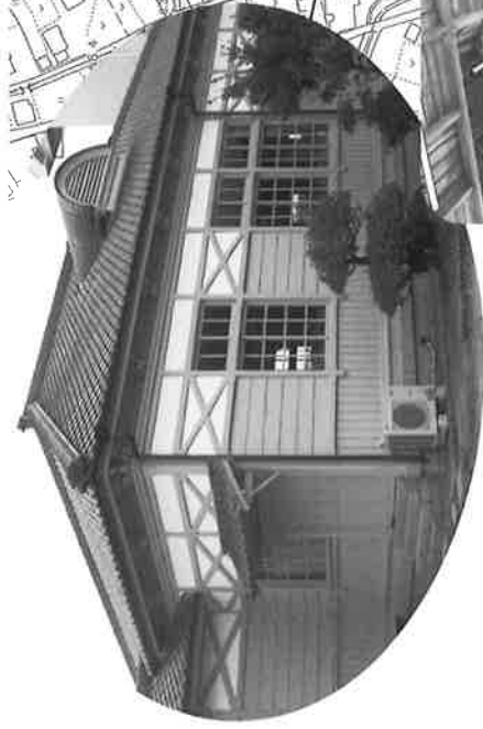
金光学園記念講堂 明治37年(1904)建築 木造平屋造