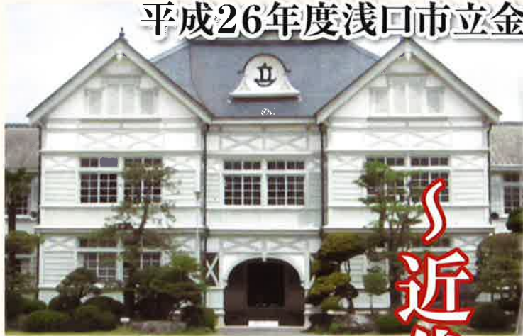
旧遷喬尋常小学校