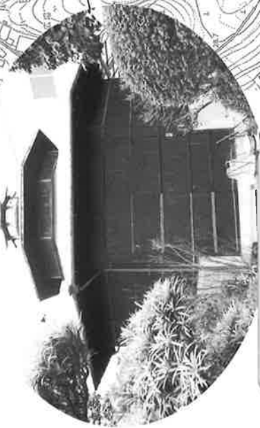
八角堂 大正3年頃(1914)建築 木造平屋建