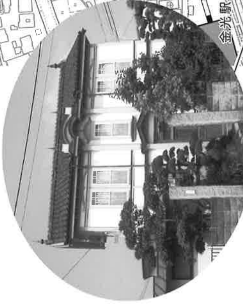
定家住宅主屋(旧定金歯科医院) 大正6年頃(1917)建築 木造二階建