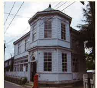
総社市まちかど郷土館

する明治期、そして下見板張り(横羽目板)によるややシンプルな大正期以降に二分される、いずれも一目で分かる巧みなデザインにあります。しかし江川本人が最もその特徴として自認していたのが内部のトラス構造の小屋組で、橋梁の設計で得たノウハウと工夫により、大講堂など柱のない大空間を有する建築物を実現しています。