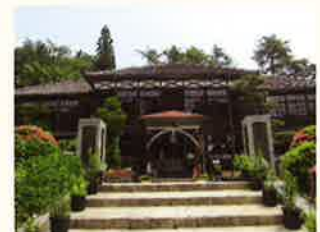
旧吹屋小学校本館