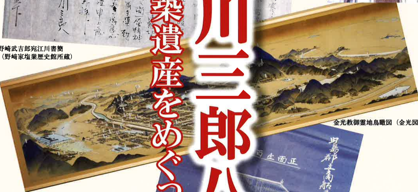
金光教御霊地鳥瞰図 (金光図書館所蔵)