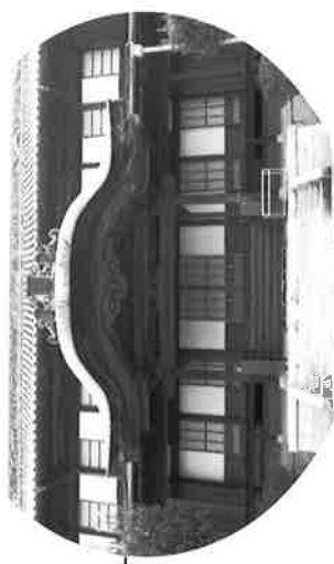
金光教学院 明治40年頃(1907)建築 木造二階建