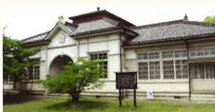
倉敷市歴史民俗資料館