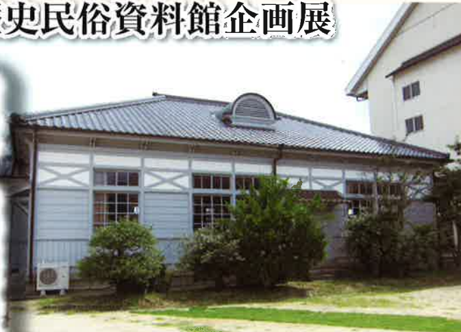
金光学園記念講堂及び格天井