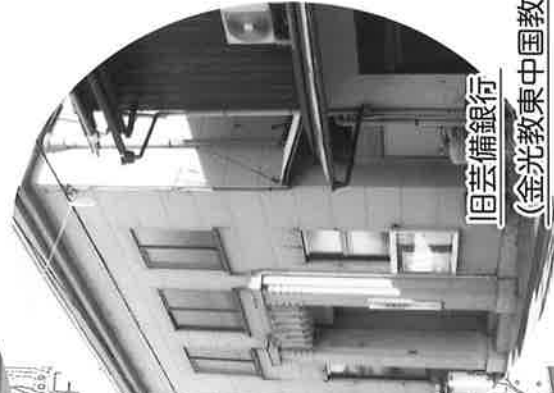
旧芸備銀行 (金光教東中国教務センター)