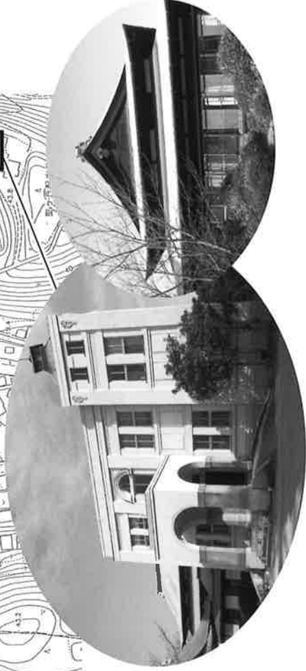
金光教教学研究所 昭和5年頃(1930)建築 日本館 木造平屋造 洋館 木造二階建