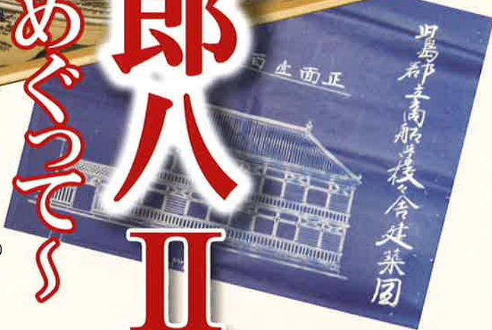
児島郡立商船学校図面 (野崎家塩業歴史館所蔵)