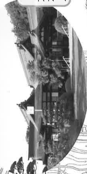
金光教修徳殿 大正15年(1926)建築 木造平屋造、切妻造及び 入母屋造