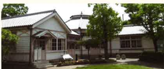
旧旭東幼稚園園舎