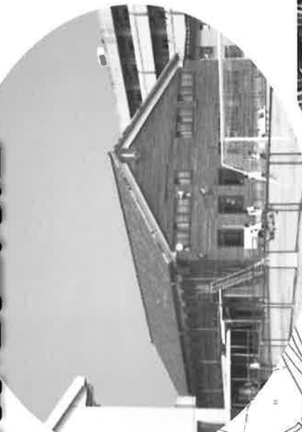
金光学園小体育館 昭和26年(1951)建築 木造平屋造