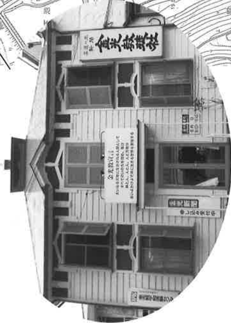
金光教徒社 大正10年(1921)建築 木造二階建