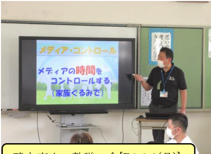
鴨方東小の熟議の会[R2.8.3(月)]