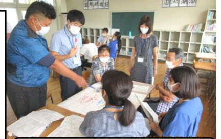
鴨方西小の熟議の会[R2.8.4(火)]

「つながり」をテーマにした詳細な取組については、役員さんと事務局の先生方で協議して、次回[10月28日(水)]の学運協で提案する予定です。