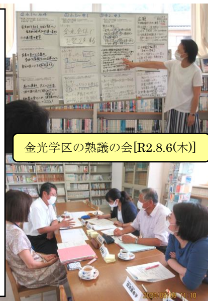
金光学区の熟議の会[R2.8.6(木)]

次回[11月5日(木)]の学運協までに、できそうなことから取り組んでいくことになりました。金光中学校校区も2学期が熱くなりそうです。