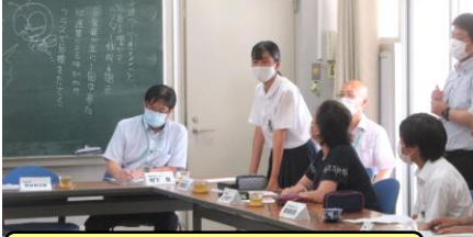
鴨方中の熟議の会[R2.8.28(金)]