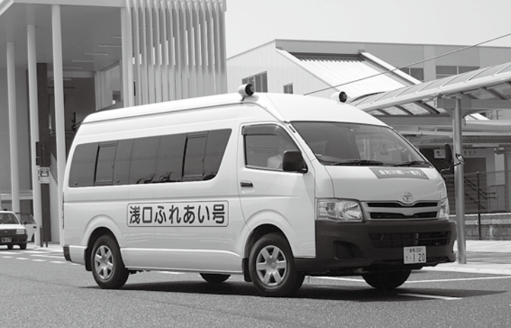
市営バス運行事業、鴨方駅周辺整備事業