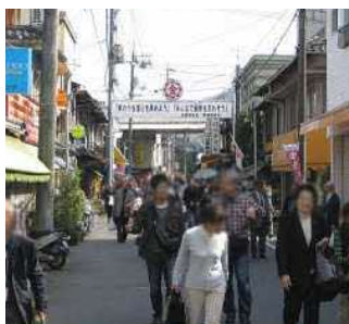
大谷地区(門前町)の様子