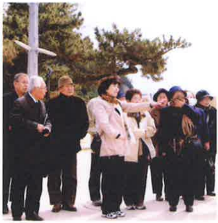
研修旅行 浜辺のミュージアム