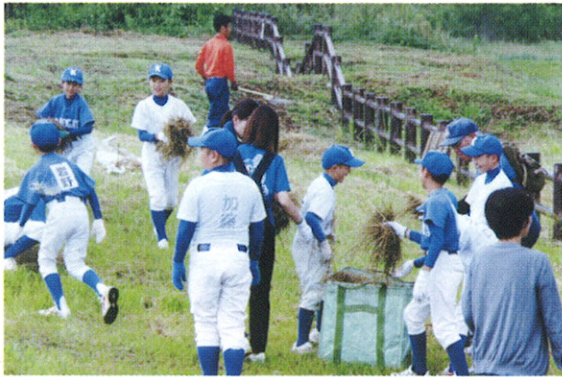
浅口少年スポーツ団