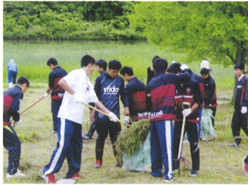
おかやま山陽高校サッカー部