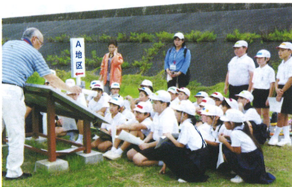
寄小アッケシソウ説明会