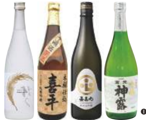
丸本酒造 平喜酒造 嘉美心酒造 神露酒造