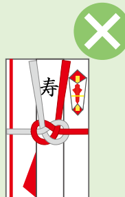
結婚祝*、香典*、卒業祝、入学祝など