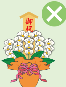
落成式・開店祝などの祝花、葬儀の供花、病見舞いなど