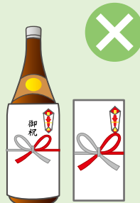
お祭りへの寄附・差し入れ、町内会の集会・旅行などの催物への寸志・飲食物の差し入れ

※政治家本人が結婚披露宴、葬式などに自ら出席してその場で行う場合には、罰則が適用されない場合があります。