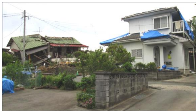
平成28年4月熊本地震