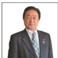
浅口市長 栗山康彦

八重の魅力を伝える「桜並木ぶらぶら散歩 in 八重」が地区の皆様により開催されますこと、心より感謝いたします。