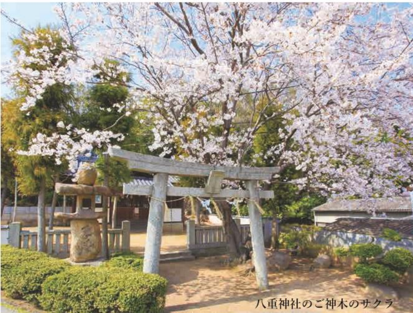
八重神社のご神木のサクラ