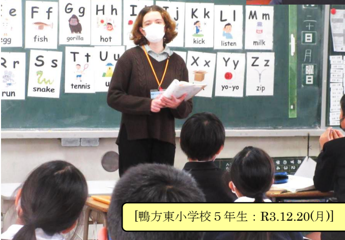
【鴨方東小学校5年生：R3.12.20(月)】