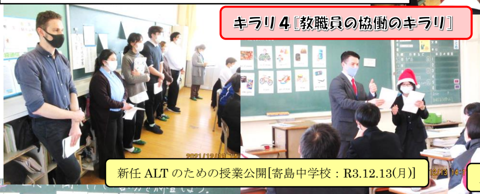
新任ALTのための授業公開【寄島中学校：R3.12.13(月)】