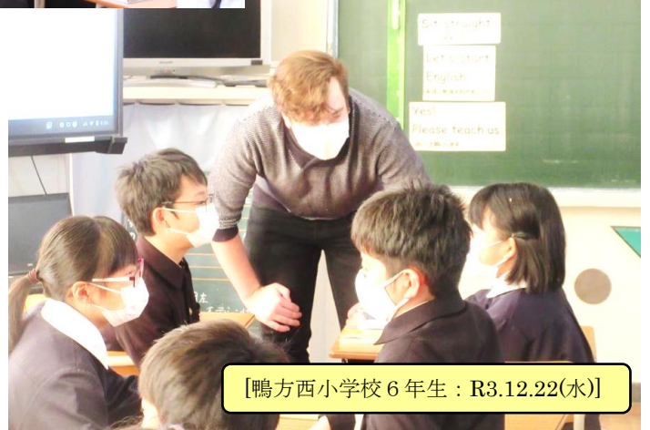
【鴨方西小学校6年生：R3.12.22(水)】