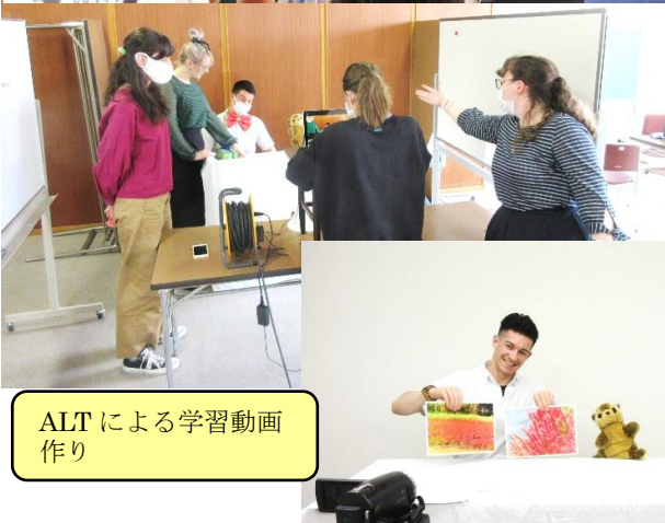
ALTによる学習動画 作り

※ALTの作成した英語の学習動画は、浅口市のHPの「くらしのガイド」内の「文化・スポーツ」コーナー、『おうちで英会話～ Asakuchi ABC ～』でご覧ください。