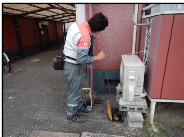
水道メータの音聴調査

4. 発注者 〒719-0192 浅口市金光町占見新田 751 浅口市役所 上下水道部水道課 TEL 0865-42-7304