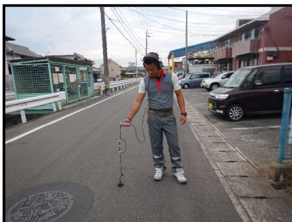
道路上の音聴調査