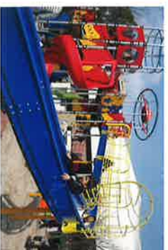
天草公園ロケット広場 オープン