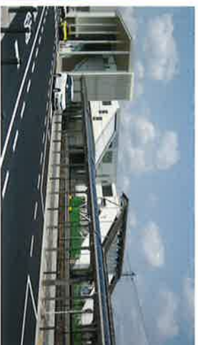
新鳴方駅 オープン