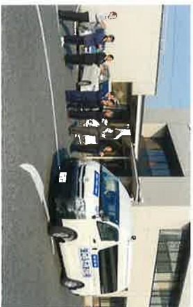
浅口ふれあい号 運行開始