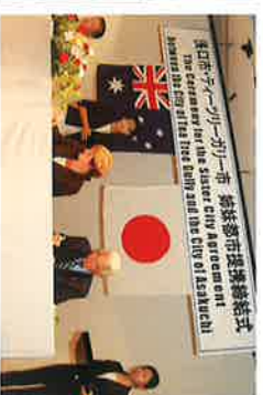
豪州T T G市と姉妹都市に