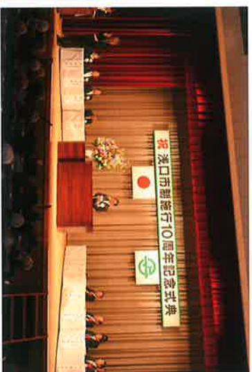
市制施行10周年記念式典