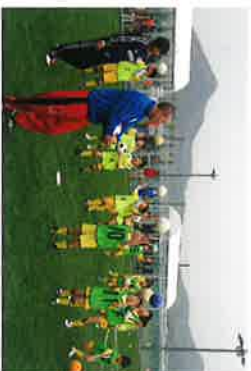
浅口市フットサル場 オープン