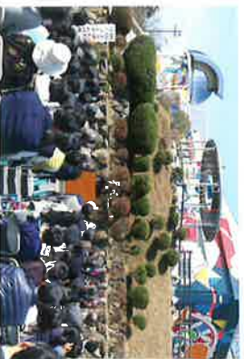
岡山天文博物館 リニューアルオープン