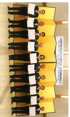
高梁川流域連携中区都市圏 連携協定締結