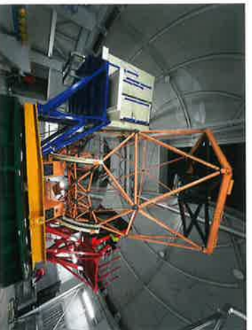
京都大学3.8mせいめい望遠鏡 完成