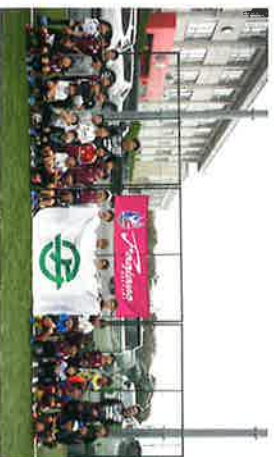
フアジャーノ岡山スポーツパーク寄島