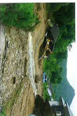
平成30年7月豪雨災害