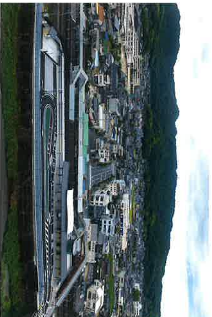
金光駅南口広場 オープン