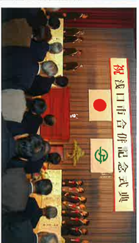
浅口市合併記念式典