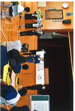
こどもまんなか広場サポーター宣言