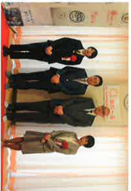
障害者相談支援センター 「はれ〜る」 開所