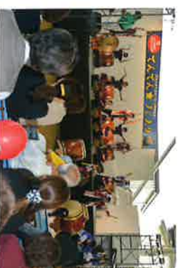
市制施行10周年記念 てんてん☆フェスタ