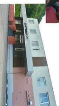
学校給食センター 完成