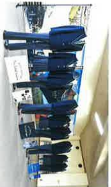
市立中学校新制服