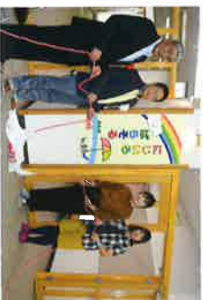
にじいろばらさる オープン