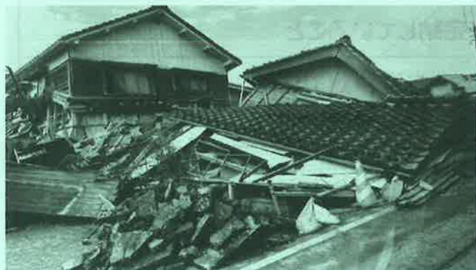
令和6年1月能登半島地震