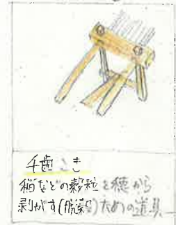
千歯さま 箱などの総称と総称 剃りばり(熊手)のための道具

ふれあいの館(西倉)は、伝承館の北側にある土蔵で安政三年に建てられた。近隣にはない立派な土蔵だ。館内には千歯さまや箕など当時使用されたものが展示されていて昔を感じとれる。また民具たちから昔の人の生活などを学ぶことができた。