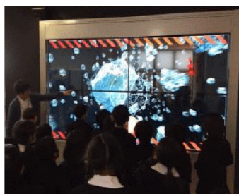
130インチ！一般的な32インチTV の約16台分の大きさ！

岡山天文博物館に大型スクリーンが完成しました。センサーを搭載しており、スクリーンをタッチして動かせます。宇宙船で任務をクリアしたり、自分だけのオリジナルの星座を作ることができます。また、ロケットに乗ったり、宇宙飛行士になった自分を映し出すことができ、タッチすることで動くので、動画での記念撮影がオススメです！ パワーアップしたスクリーンを岡山天文博物館で体験しましょう！