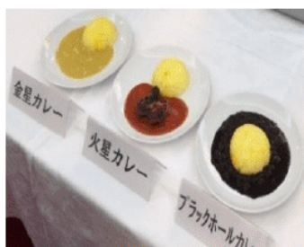
美味しさも遊び心も宇宙ー！？

「天文のまち」PRのため、遊び心あふれる3種のカレーをおかやま山陽高校の料理研究部が考案してくれました！その名も「宇宙カレー」イイダコを宇宙人にみたく「火星カレー」、金箔が豪華な「金星カレー」、黒いルーが衝撃の「ブラックホールカレー」が完成し、全て美味しかったです。現在、市内飲食店での提供や土産として商品化を目指しており、多くの方に召し上がっていただけたら嬉しいです！