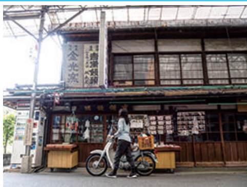
金光町門前町のノスタルジックな街並をカブで視察。

浅口市内を愛車のカブ号でめぐったり、特産品を学んだり、地域のイベントに参加し、地域おこし協力隊のフェイスブックなどで発信中です。 金光町・須恵地区のどろんこ祭りでは田植え前の田んぼで子どもたちと泥だらけ！この時期ならではの地域ならではの、元氣な風物詩ですね。 今後さらに市内外へ魅力を発信できるようながんばります。「この地域にはこんな魅力があるよ」といった素敵な情報を、ぜひ教えてください。