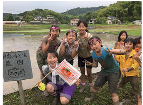
金光町・須恵地区のどろんこ祭りに参加。どろだらけ！