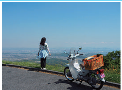
遙照山からの展望！風が気持ちいい。