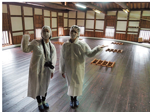
丸本酒造さんの酒蔵見学。丁寧な作業工程に感動。