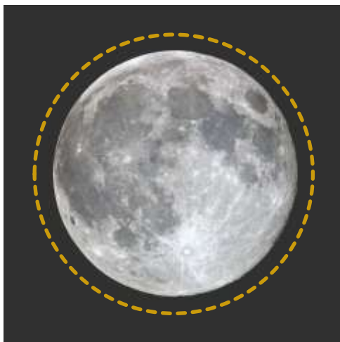
図2. 2016年4月22日の満月(写真)と今年最大の満月(点線)の大きさ比べ

地球の周りをまわっている月の軌道は、少しゆがんだ円(楕円)の形をしています。そのため地球から月までの距離は、月が地球の周りを一周する約27日の間で、およそ36万から40万キロメートルまで変化します。それにもなると月の見かけの大きさも、地球と月が近い時には大きく、遠い時には小さく見えるようになります。