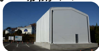
岡山天文博物館facebookで 動画公開中！