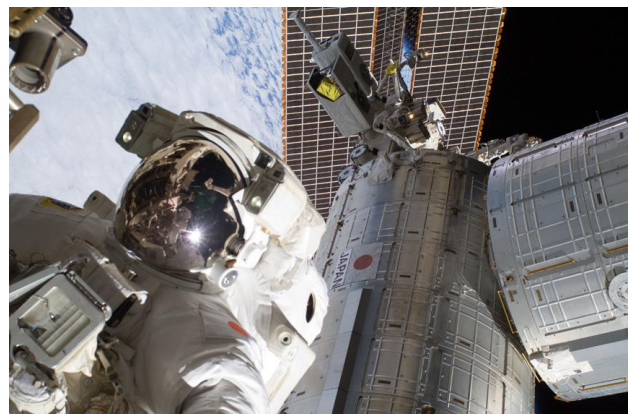
図. 船外活動をおこなう星出宇宙飛行士と「きぼう」日本実験棟

また、博物館では、この秋「体感しよう! 有人宇宙開発展」として、この ISS や宇宙飛行士たちを宇宙へ連れて行くためのロケットなど、有人宇宙開発に使われるさまざまな宇宙船の模型の展示や、ミニトクなどをおこないます。ぜひ自分の目で ISS の光を見て、そして企画展で ISS や宇宙開発の歴史を感じてみてくださいね。