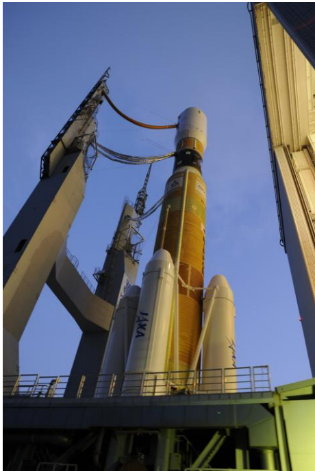
図2. 打ち上げ前の H-II B ロケット3号機

国際宇宙ステーションの実験モジュールはアメリカ、日本、ヨーロッパ、ロシアがそれぞれ開発したものがあり、日本が開発した実験モジュールを「きぼう」といいます。きぼうは、主に「船内実験室」、「船外実験プラットフォーム」、「船内保管室」、「船外パレット」、「ロボットアーム」、「衛星間通信システム」の6つの部分からなるのでこれも模型で確認してみましょう。